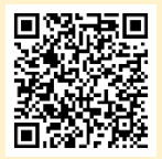
「ラーケーションの日」活動例